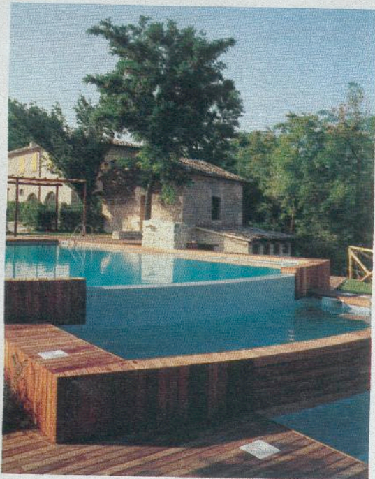
L'angolo relax dell'Urbino Resort, nuova destinazione per le vacanze tra natura, spa e città d'arte. La doppia costa 125 euro al giorno.

visitdenmark.com. L'estate low-cost continua anche con i concerti nei parchi e nelle piazze in occasione del Copenhagen Jazz Festival (dal 4 al 13 luglio). Lo stage principale è un palco galleggiante attraccato alla banchina del porto di Copenhagen attraverso il Danhostel City Hostel. ( www.jazzfestival.dk ). Dal 10 al 20 agosto, invece, si svolge il Summer Dance, con corpi di ballo moderni e classici, all'interno della stazione di polizia, normalmente chiusa al pubblico ( www.danishdance.com ).