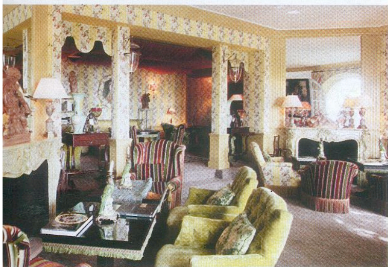
FIENILE CON VISTA Da sinistra in senso orario. Una veduta aerea del complesso fondiario che ospita il relais Villa La Bianca, in Lucchesia; il fienile dove è stato realizzato il centro benessere del nuovissimo Urbino Resort; uno scorcio delle parti comuni di Villa Gallici, ad Aix-en-Provence.